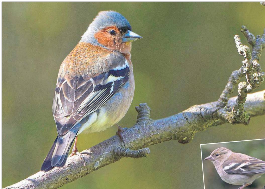
Das Buchfinkmännchen ist ein Beau: Gefieder bunt, Brust weinrot, Kopf hellgrau. Weibchen (r.) tragen ein schlichtes Federkleid.

WALDECK-FRANKENBERG. Vor über 50 Jahren habe ich mich bereits für die Vogelwelt in unserem großen, baumbestandenen Garten in Mengerhausen interessiert. In meinen damaligen Notizen ist der Buchfink ( Fringilla coelebs ) nicht zu finden. Er hat also auch wie Dompfaff, Ringeltaube und Kleiber vor noch nicht allzu langer Zeit seinen