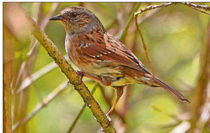
Gäste an der Futterstelle im Garten: Birkenzeisig (oben), Bergfink (links) und Heckenbraunelle.