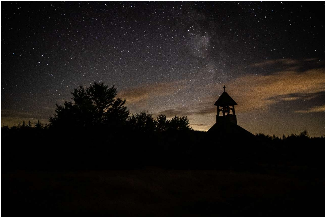
Foto von der Quernst bei sternklarer Nacht (Quelle: K. Rotthowe).

am 22.11.2024 im Vereinsheim des Rassegeflügelvereins (RZGV) Frankenau