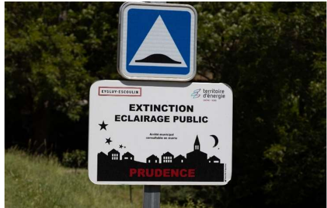
Mit gutem Beispiel voran: Hinweisschild der französischen Partnerstadt Die zur nächtlichen Lichtabschaltung als Maßnahme zur Reduktion der Lichtverschmutzung.

Die Beleuchtung mittels LED ist seit Jahren in aller Munde. Trotz ihrer besseren Energieeffizienz führt ihr Einsatz nicht immer zu einer Energieeinsparung. Wenn LED nicht sachgemäß betrieben werden, sorgt der Rebound-Effekt (der Einbau von immer mehr Leuchten) insgesamt sogar für einem Mehrverbrauch. Die Lichtverschmutzung nimmt dadurch zu und auch die Beeinträchtigung von Flora und Fauna verstärkt sich.