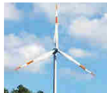
Windkraft spaltet.

In einer Sondersitzung einigte sich das Stadtparlament am Dienstagabend im Höringhäuser Bürgerhaus mit großer Mehrheit auf eine Stellungnahme zum Teilregionalplan in Sachen Windenergie.