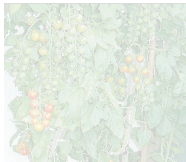
Tomaten lassen sich auch gut in Kübeln ziehen. Die Erde sollte jedes Jahr vorsichtshalber erneuert werden.

GARTENTELEFON: Natürlich können sie die Kübelpflanzen-erde vom vergangenen Jahr etwas aufarbeiten und noch einmal verwenden. Dazu sollten sie die Erde in einen Mauerkübel umschütten, alle alten Wurzeln entfernen und auch andere Pflanzenreste oder Fremdstoffe entfernen. Anschließend sollten sie der alten Erde rund ein Drittel frische Erde hinzufügen und vermischen. Sie können die Stickstoffversorgung mit Hornspänen sicherstellen – aber bitte die Mischung nicht jetzt schon herstellen, sonst werden bis zum Topfen unter Umständen zu viele Nährstoffe freigesetzt. Sie können der Mischung auch kleinere Mengen