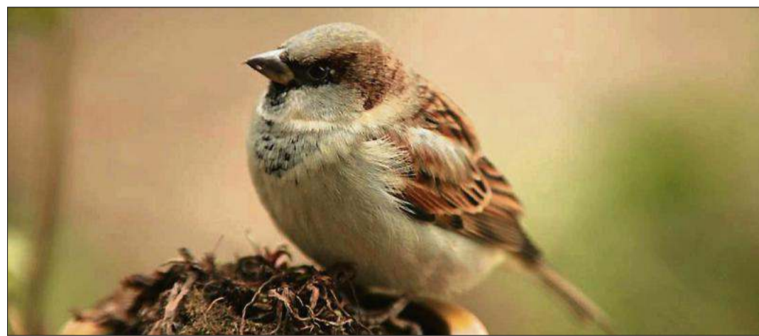
Auf der Vorwarnstufe der Roten Liste: der Hausperling.