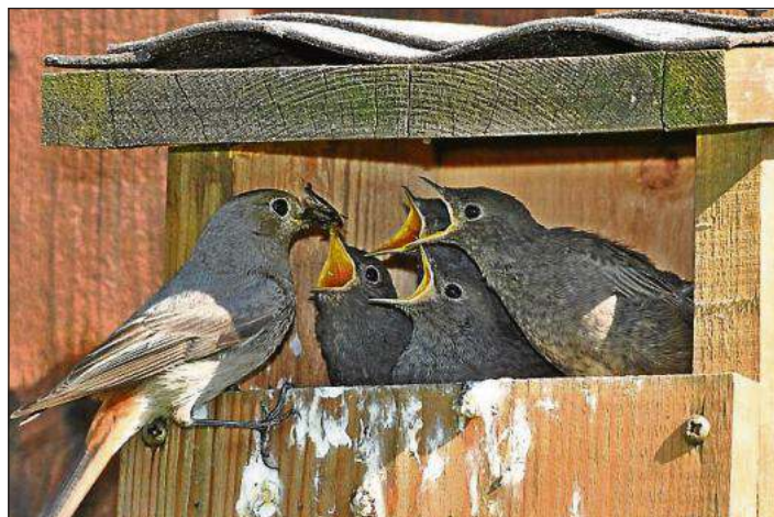
Hausrotschwanz füttert nach einem Ausflug die Jungen in dem Halbhöhlen-Nistkasten.