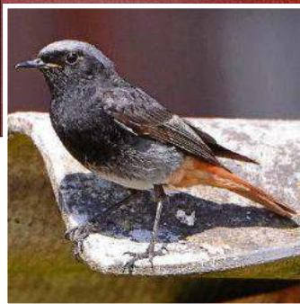
Zierlich ist der Hausrotschwanz – oben das Weibchen, links das Männchen, rechts der Weißling.