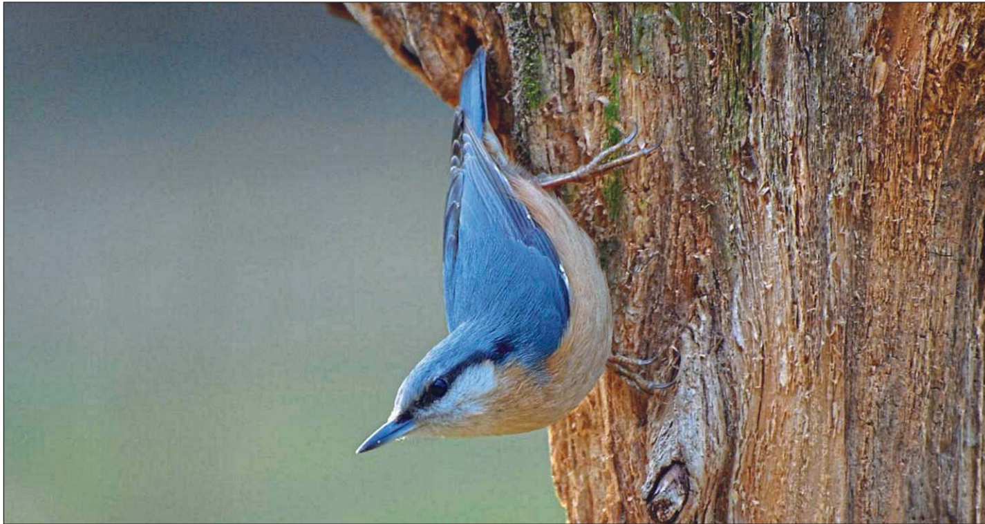
Der Kleiber ist in unseren Breiten der einzige Vogel, der mit dem Kopf voran abwärts am Stamm entlang laufen kann. Kleiber brauchen alte Baumbestände zum Überleben.

Er ist fast pausenlos in Bewegung. Dabei sucht er vor allem unter Baumrinden nach Insekten und klettert dabei geschickt und schnell stammwärts. Und er ist der einzige Vogel in Deutschland, der mit dem Kopf voran am Stamm sogar abwärts klettern kann. Dazu setzt er seine Beine so auf, dass immer einer oben und einer unten fest sitzt. Der Kleiber ist auch unter „Spechtmeise“ bekannt, denn im Winter erscheint er oft zusammen mit Meisen und hämmert grobe Samen spechtartig auf.