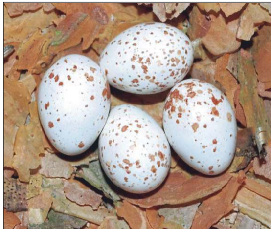
Auf die weiche, dünne Spiegelrinde der Kiefer legen Kleiber ihre Eier gern ab.