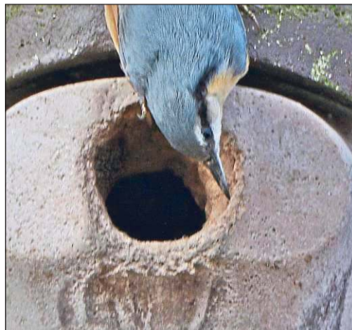
Kleiber verengen mit einer Mischung aus Lehm und Speichel ihre Bruthöhlen.

Kleiber sind standorttreu: An einem einmal ausgewählten Revier hält der kurzschwanzige Vogel sein Leben lang fest.