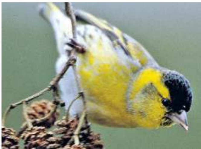
Die Beobachter entdeckten entlang der Eder viele der nördlichen Erlenzeisige beim Ernten der Samen.

Seit nunmehr 18 Jahren läuft die ornithologische Forschungsaktion entlang der Eder, die mit der Zählung im Februar ihren Abschluss findet. Das Unterfangen setzt eine genaue Vorberei-