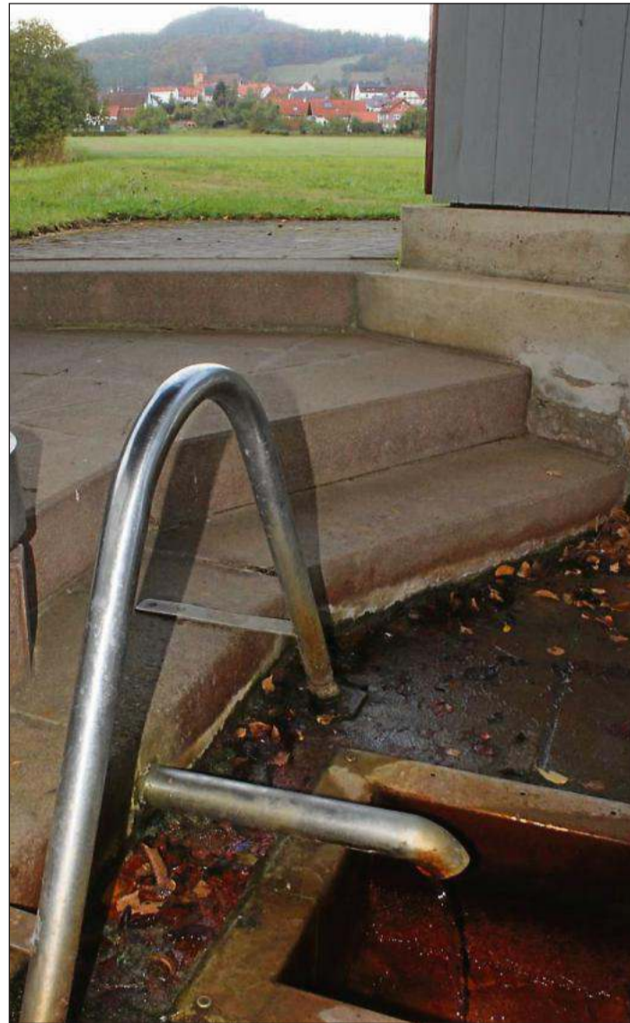
Die schmuckeste der drei Quellen ist der Dorfbrunnen, im Hintergrund Grünland und der Kleinerer Dorfkern.

MAI: Im Rahmen der Vertragsverhandlung hat es einen intensiven Austausch mit der