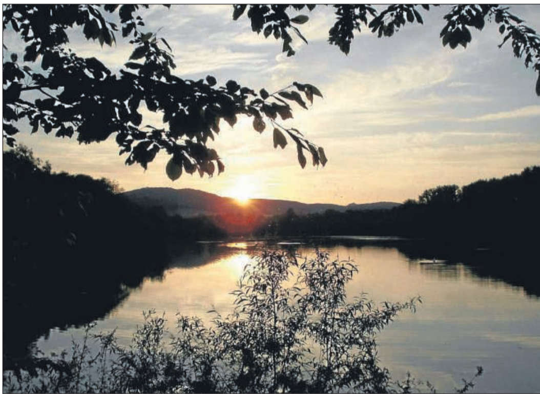
Zugabe: Einen Gratis-Sonnenuntergang gab es neben interessanten Naturbeobachtungen im Naturschutzgebiet Schwimmkaute obendrauf.

Still scheint es hier zu sein, lediglich eine größere Zahl von Höckerschwänen und Blässhühnern bewegt sich auf der Wasseroberfläche des ehemaligen Kiesabbaugeländes. Doch bei genauerem Hinsehen tut sich hier eine ganze