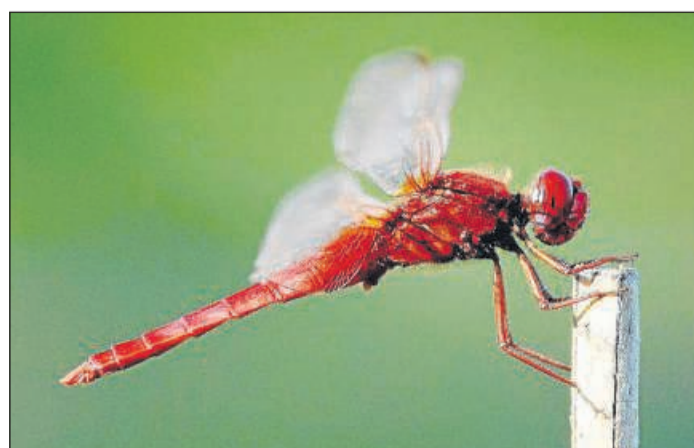
Auf dem Verbreitungsweg nach Norden: Auch die Feuerlibelle hat das Naturschutzgebiet Schwimmkaute für sich entdeckt.