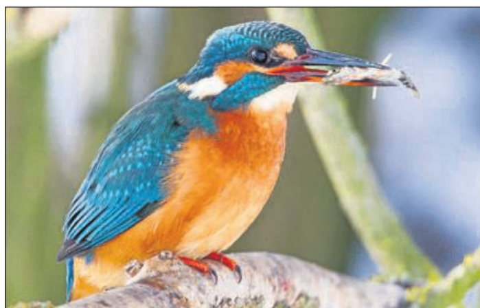
Ein prachtvolles Federkleid: Mit etwas Geduld lässt sich der Eisvogel am Ufer der Eder oder des Wesebachs beobachten.

Dafür gibt es aber jetzt ein Froschkonzert. Einer beginnt, und eine Vielzahl seiner Artgenossen stimmt lautstark in den Chor ein. Die 30 Minuten sind zwar jetzt abgelaufen, aber ich bleibe noch sitzen. Mal sehen, was die Natur hier noch alles zu bieten hat.