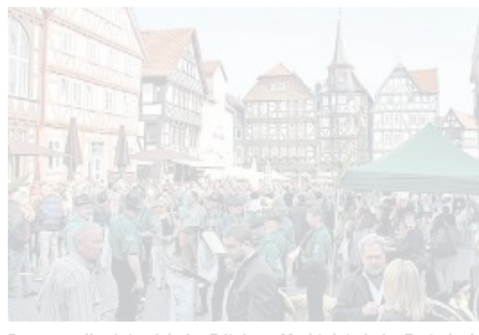
Proppenvoll zeigte sich der Fritzlarer Marktplatz beim Erntedankfest am Wochenende.