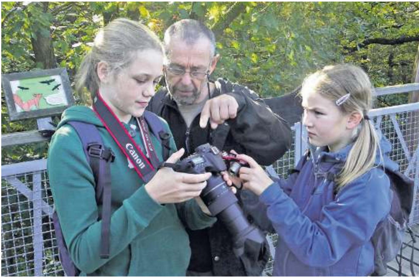
Wertvolle Tipps gab's vom preisgekrönten Naturfotografen Manfred Delpho für die jungen NABU-Gäste.

Bad Wildungen - Altwildungen. Der Förderverein Kindergarten Altwildungen lädt am Sonntag, den 12. Oktober 2014 zum „Herbstbasar – rund ums Kind“ ein. In der Zeit von 14 bis 16.30 Uhr werden im Bürgerhaus Altwildungen (Grüner Weg 7) an über 30 Verkaufstischen ganz verschiedene Sachen angeboten. In gut gebrauchter Qualität findet man hier Kinderkleidung, Spielsachen, Bücher, Kinderwagen und vieles mehr. Während die Eltern oder Großeltern an den vielen Tischen stöbern, gibt es für die Kinder einen Maltisch. An der großen Kuchentafel können leckere selbstgebackene Kuchen und Torten verzehrt und auch mitgenommen werden. Der Erlös aus Kaffee und Kuchen geht an die Kindertagesstätte „Die kleinen Strolche“ in Altwildungen. Wie bisher fließt das Geld in Spielgeräte für innen wie außen. (r)