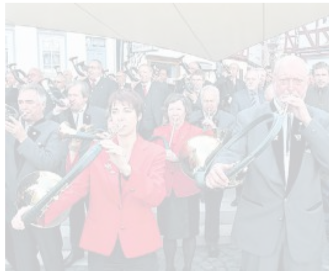
Viele Jagdhornbläser, unter anderem aus Frankenberg, nahmen am Bläserjubiläum des Kreisjagdvereins teil.

Dekorative Ideen für den Herbst, Schüsseln und Schalen, handgemacht aus Holz, oder vielleicht die eine oder andere Strickmütze für den kommenden Winter. Die Kinder ließen sich derweil gerne schminken oder zeigten so manchem Kürbis, aus welchem Holz sie geschnitzt waren. Aber auch zahlreiche andere Angebote luden die vielen Besucher zum Planieren und Bummeln ein. (hil)