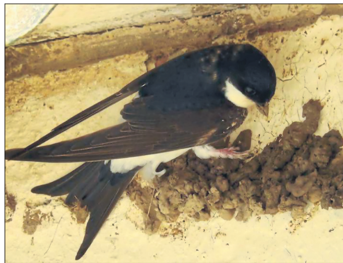
Eifriger Nestbauer: Die Mehlschwalbe führt in Waldeck-Frankenberg die Liste der gezählten Gartenvögel mit deutlichem Vorsprung vor dem Haussperling an.

Nicht nur der NABU will aus der Aktion einen wissenschaftlichen Gewinn erzielen. Auch die Teilnehmer profitieren. Sie können ihre Artenkenntnisse vertiefen, künftig noch genauer beobachten, ihre Gärten vogelfreundlicher gestalten und schließlich können sie durch ihre Teilnahme Preise gewinnen, wie ein hochwertiges Fernglas, Reisen, Gutscheine und vieles mehr. (zqa)