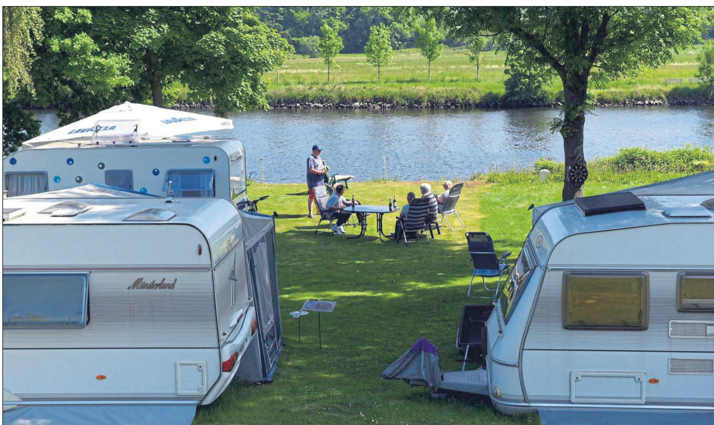
Camping liegt im Trend: Deutschlandweit wurde erstmals die 30-Millionen-Marke bei den Übernachtungen geknackt, in Waldeck-Frankenberg waren es 2016 fast 200 000 Übernachtungen.

Nach Polizeiangaben wurde der Hund sichergestellt und in die Obhut eines Tierheimes gegeben. Polizei-Pressesprecher Volker König: „Was nun mit dem Hund weiter passiert, muss das Ordnungsamt der Stadt Lichtenfels entscheiden. Die Polizei ermittelt wegen fahrlässiger gefährlicher Körperverletzung gegen den Hundehalter.“ (r/off)