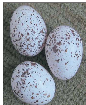
Rauchschwalben bebrüten bis zu fünf Eier bis zu 19 Tage.

Der Name der Rauchschwalben geht bis in vergangene Jahrhunderte zurück, weil sie im Rauch offener Kamine ihre Nester anlegten.