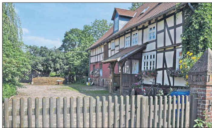
Ein rauchschwalbenfreundlicher Hof findet sich in Oberwaroldern – bei einer Miste finden die rasant fliegenden Stallschwalben genügend Nahrung. Hilfe bieten auch offene Pferdeställe.