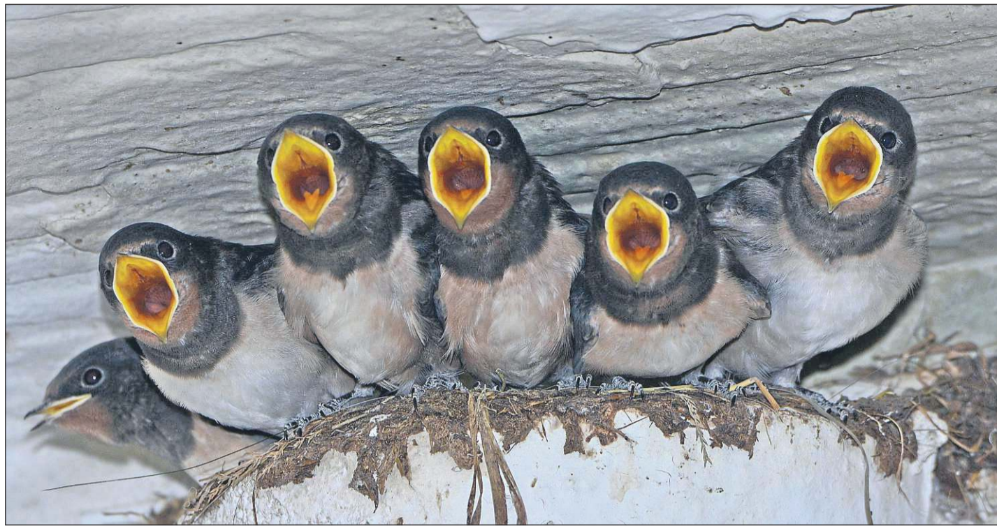
Rauchschwalben-Nachwuchs: Die Eltern haben viel zu tun, um den Jungen genügend Nahrung zu suchen. Bereits nach rund drei Wochen werden die jungen Vögel flügge.

In Oberwaroldern dagegen fühlen sich die Rauchschwalben auf dem althergebrachten kleinen Hof des Freizeitbau-