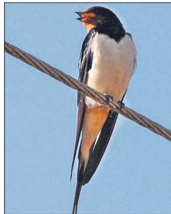
Rauchschwalben haben ein rotes Gesicht und eine blauschwarze Kehle.