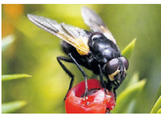
Guten Appetit: Rinderfliege.