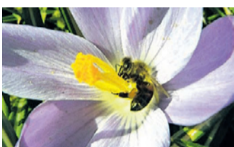
Liebt Krokusse: die Biene.