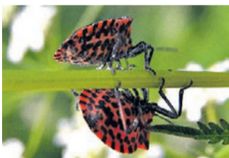
Im Doppelpack: Streifenwanzen.