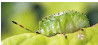
Von unten: Grüne Stinkwanze.